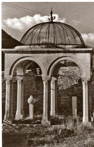
Mustafa Ejubović (Šejh Fuji) turbe

Na ulazu u mostar iz pravca sarajeva naići ćemo na turbe u kojem je ukopan Mustafa Ejubović poznatiji kao šejh Jujo. O ovom velikanu nažalost malo se zna i u Mostaru, a kamo li dalje, a o kakvoj je veličini riječ reći će nam i ova hikaja.